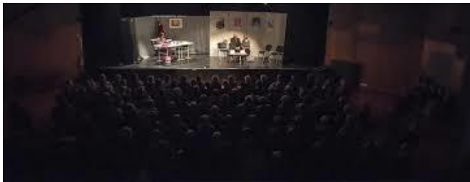
Photo : La scène de l'espace Grangette