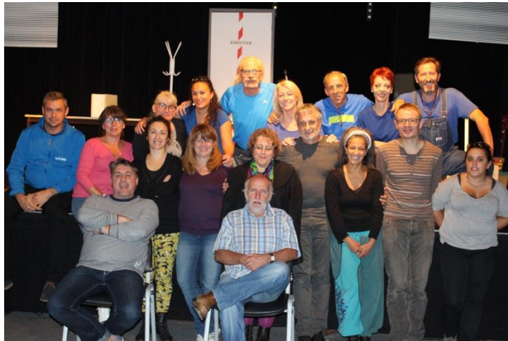
Photo : Edition 2017, l'équipe de l'organisation avec les comédiens de la malle au grenier et la compagnie les femmes s'inventent.

Cette année c'est la troisième édition et nous invitons à postuler pour présenter le fruit de votre travail en septembre 2018.